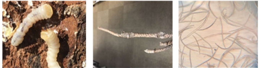
マツノマダラカミキリの幼虫 カミキリの食痕 マツノザイセンチュウ

ただし、三保半島内にはまだマツ材線虫病が残っており、半島南部の被害も外部から侵入の可能性が高いことから、油断せず徹底した防除を継続する必要がある。