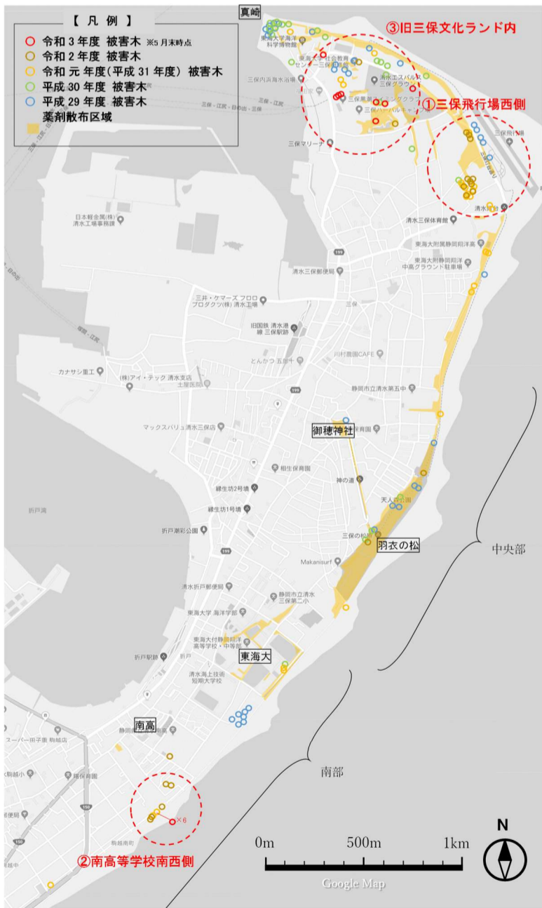
マツ材線虫病被害発生位置図